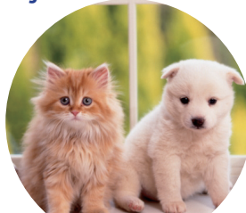
ø ý ø Æ ý €