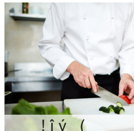
! î ý ( é . î - © "